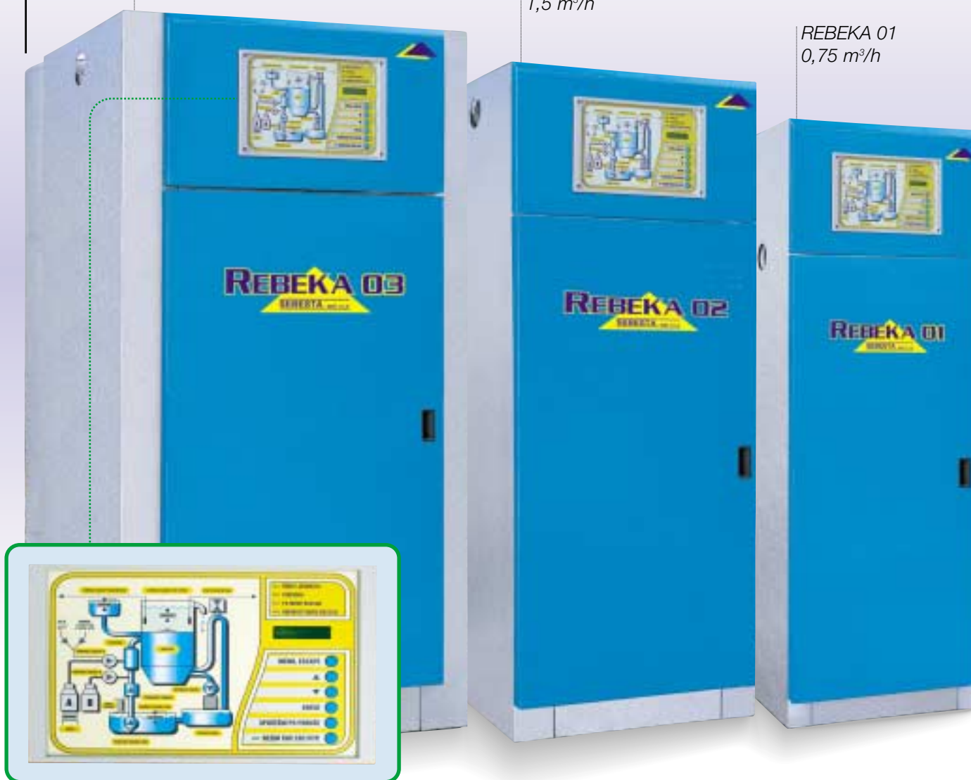
REBEKA 01 0,75 m 3 /h